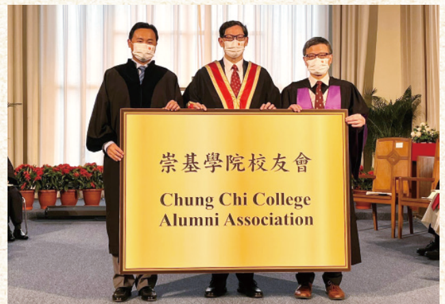
崇基校友會捐款予母校