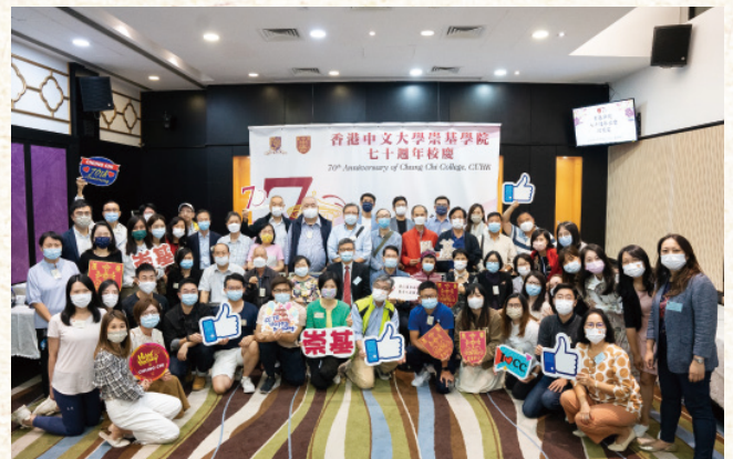
「七十週年校慶回家宴」