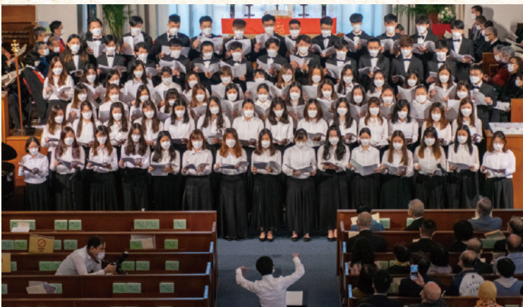
崇基合唱團獻唱七十週年校慶主題曲《主愛在崇基》