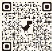
「崇文鳳篆 —— 崇基七十週年校慶藝術作品展」虛擬實景展覽