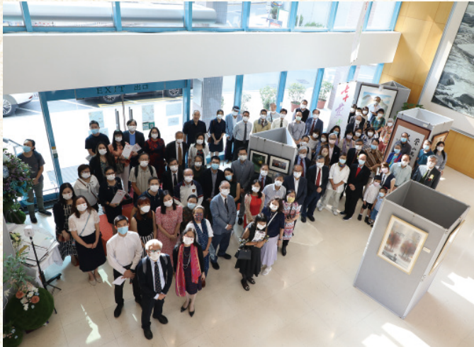
崇文鳳篆 —— 崇基七十週年校慶藝術作品展

至於校慶日下午則在崇基行政樓大堂展覽廳舉行了「崇文鳳篆 —— 崇基七十週年校慶藝術作品展」開幕典禮。展品來自崇基師生、校友和友好的藝術佳作，共五十六件，內容有以七十校慶、校園景色為題，亦有表意抒情、寫景詠物之作品。校慶藝術作品展現以虛擬實景形式在網上繼續展出，歡迎校友瀏覽觀賞。