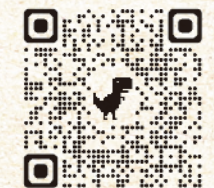
全球校友大合唱短片