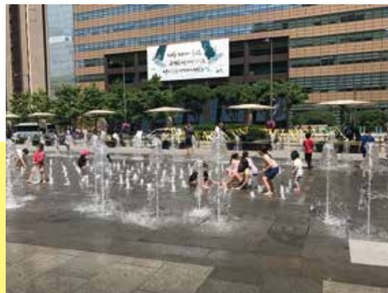
好的規劃和社區設計，就會多人使用。伍教授說人的身體最誠實，會用身體來投票選出規劃得好的空間，例如韓國首爾的清溪川(左)和噴水池(右)。