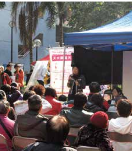
「天水圍露天墟市想創坊」由中大城市研究課程及其他社區發展組織合辦，希望通過工作坊讓街坊、檔主及墟市營運者等建立天水圍墟市，連接社區。