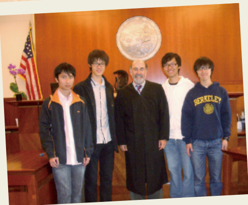
同學前往三藩市高等法院與法官交流，了解當地法庭運作程序