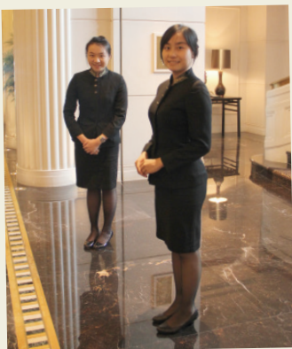
我(右)與利天兒同學 於上海半島酒店實習

崇基自一九五一年成立至今，六十多載的春風化雨中作育了各行各業的英才。諸位師兄姐從未忘本，無論身在何方，對母校、師弟妹總是一呼百應。不久的將來我們也將成為崇基校友，相信我們十位同學也都必定會效法師兄姐，盡己所能回饋母校。