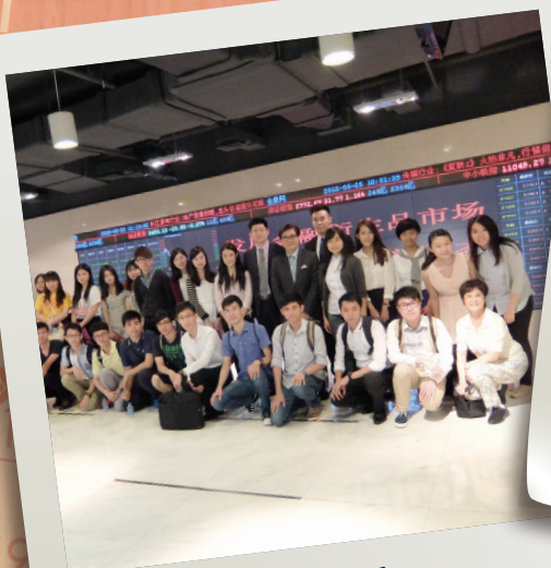
訪問中國金融期貨交易所