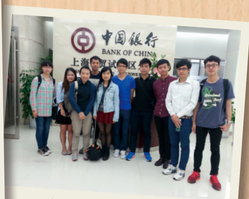
十位崇基同學考察上海自貿區的中國銀行