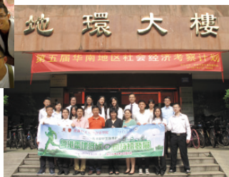
華南地區段：七月二十七至八月一日 香港段：八月三至八日