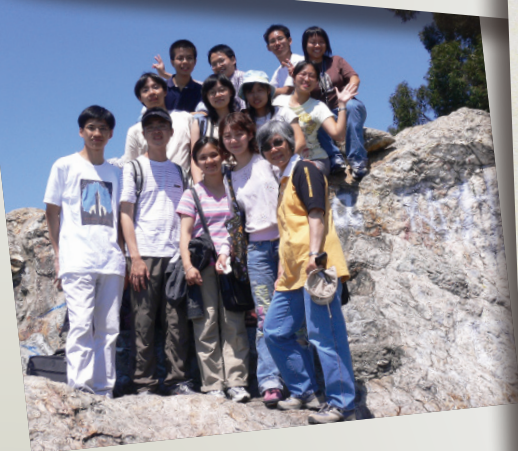
遊覽柏克萊之印寧安石