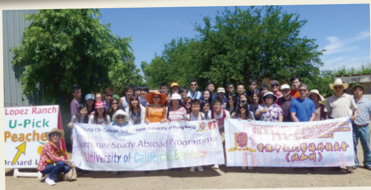
同學與中大校友到果園採摘車厘子