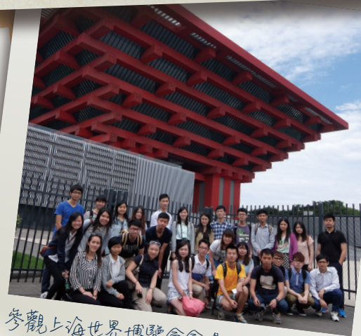
參觀上海世界博覽會會場