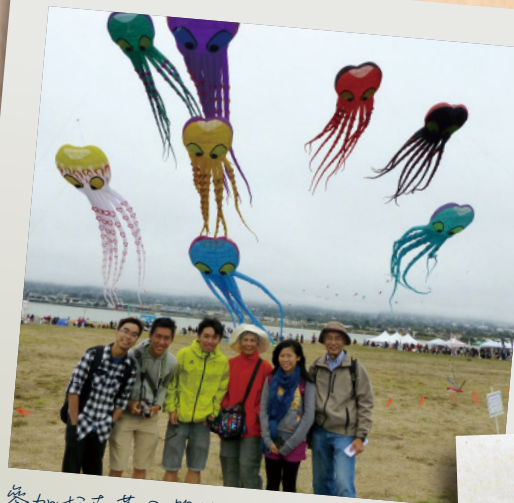
參加柏克萊風箏節