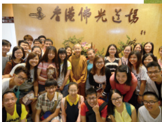
甘青段：七月二十至二十九日 香港段：八月四至十三日